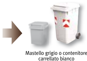
Mastello grigio o contenitore carrellato bianco

Conferire il materiale sfuso, ben sciacquato e schiacciato per ridurne il volume.