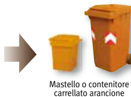
Mastello o contenitore carrellato arancione

Conferire il materiale sfuso e ben sciacquato.