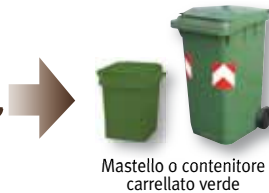
Mastello o contenitore carrellato verde

Conferire il materiale in qualsiasi sacco ben chiuso