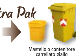
Mastello o contenitore carrellato giallo

carta e contenitori Tetra Pak (latte, succhi, vino, ecc...)